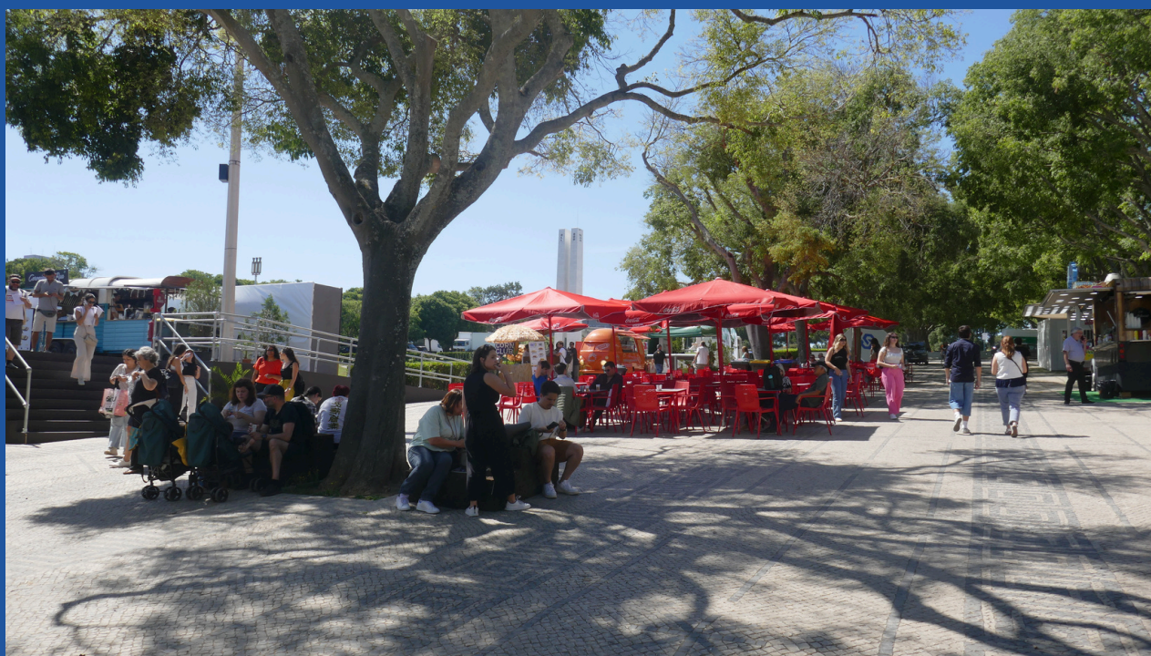
Zonas de descanso