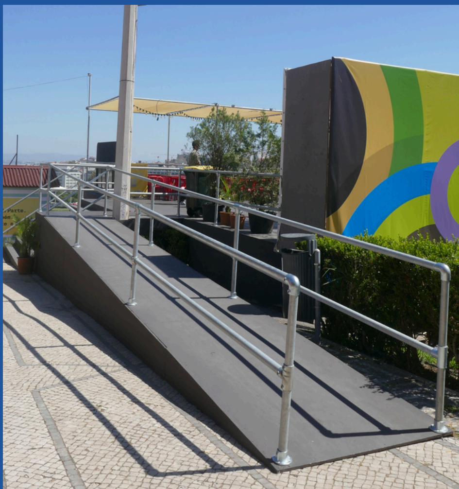
Acesso à zona de restauração - rampa.

Este é o aspeto de alguns dos acessos à zona de restauração: