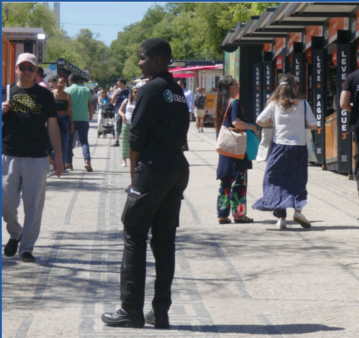
Membro da segurança.

Os membros de segurança estão fardados assim: