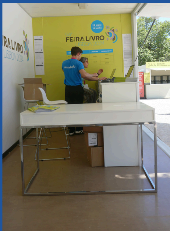
Balcão de informações rebaixado da Entrada Sul.