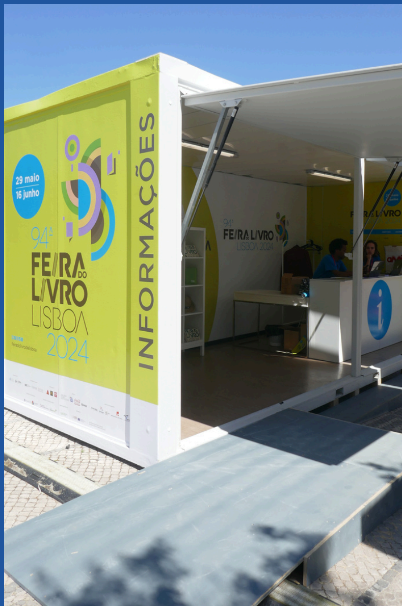
Zona envolvente do balcão de informações da Entrada Norte.

O balcão de informações da Entrada Norte tem o seguinte aspeto: