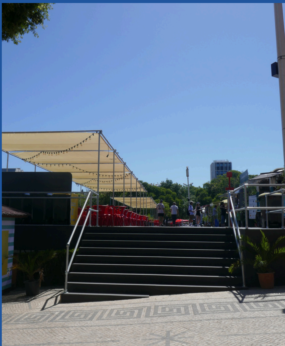
Acesso à zona de restauração - escadas.

Este é o aspeto de alguns dos acessos à zona de restauração: