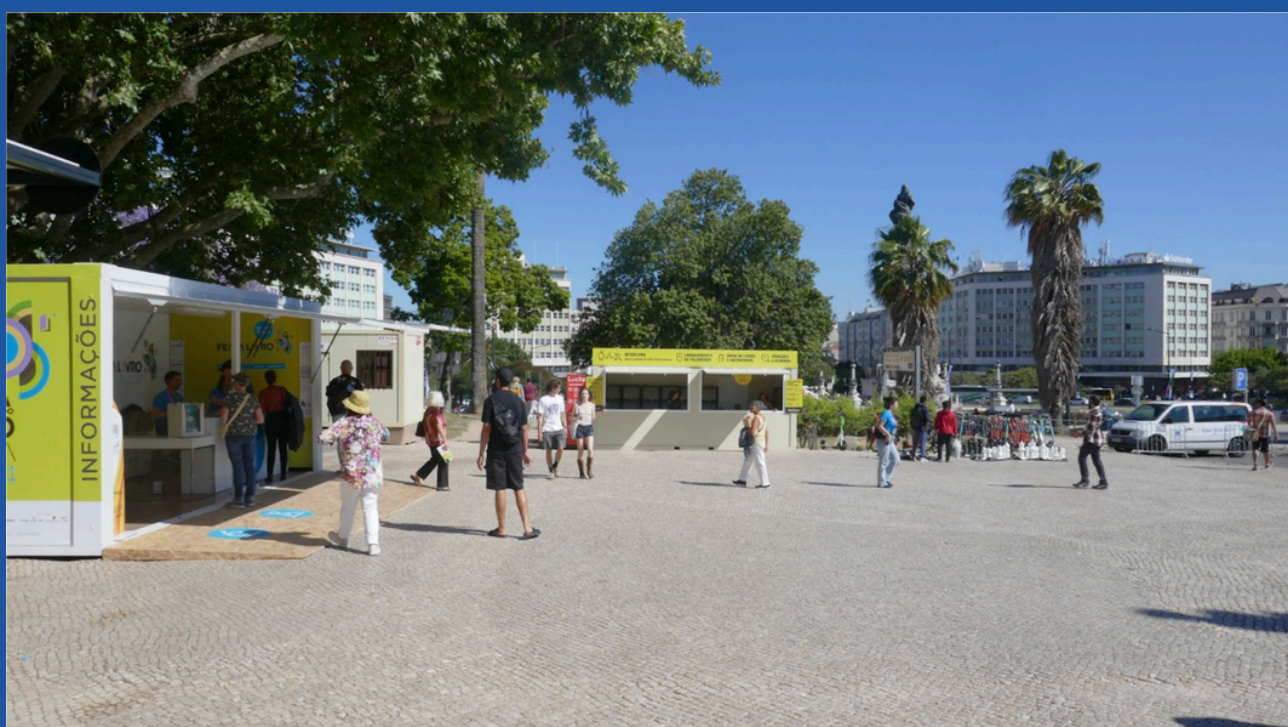
Zona envolvente do balcão de informação da Entrada Sul.

O aspeto do balcão da Entrada Sul é este: