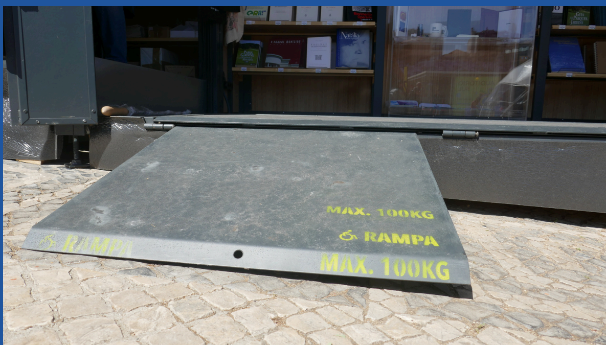
Aspeto e identificação das rampas dos pavilhões.