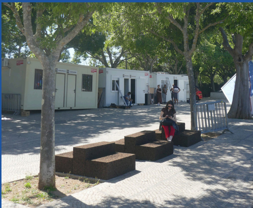
Zonas de descanso