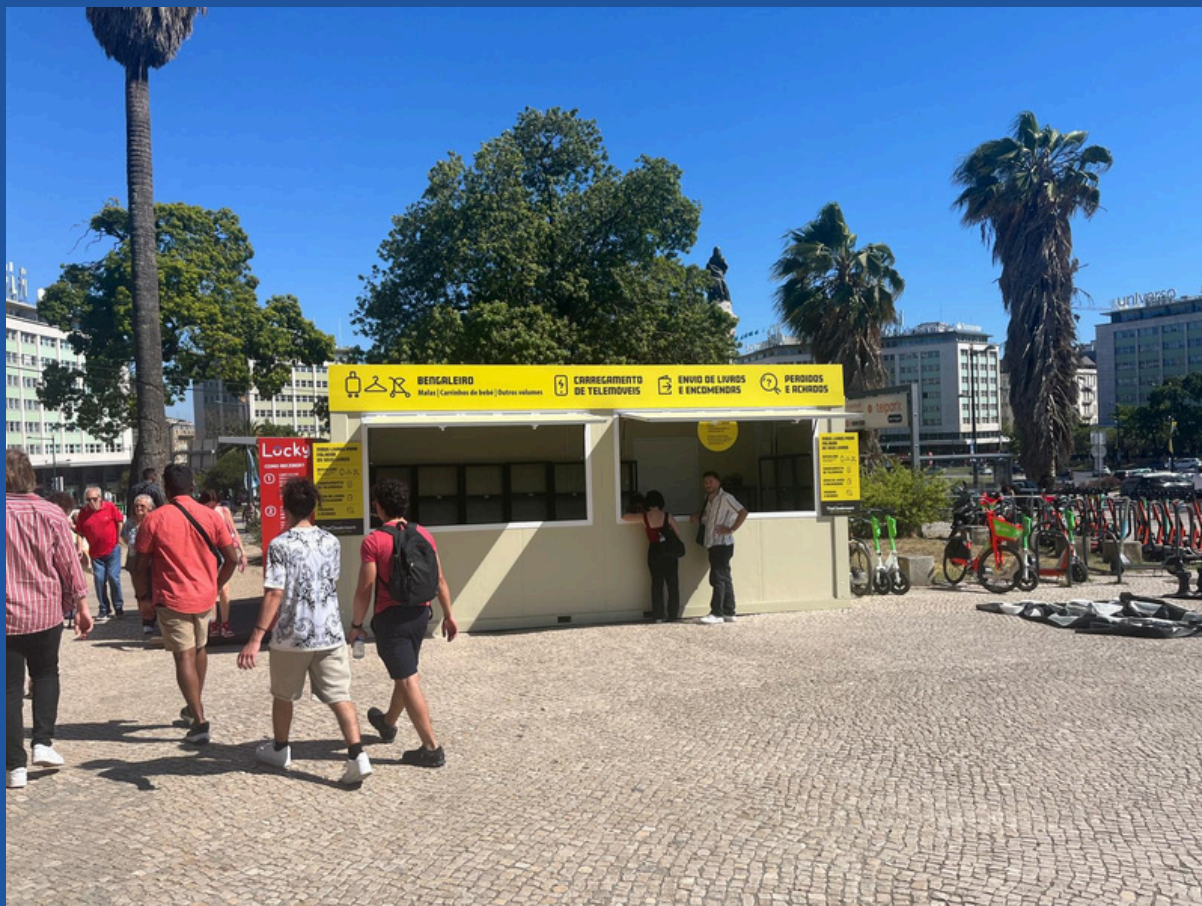
Aspeto externo do bengaleiro.

Este é o aspeto do bengaleiro da Feira do Livro de Lisboa: