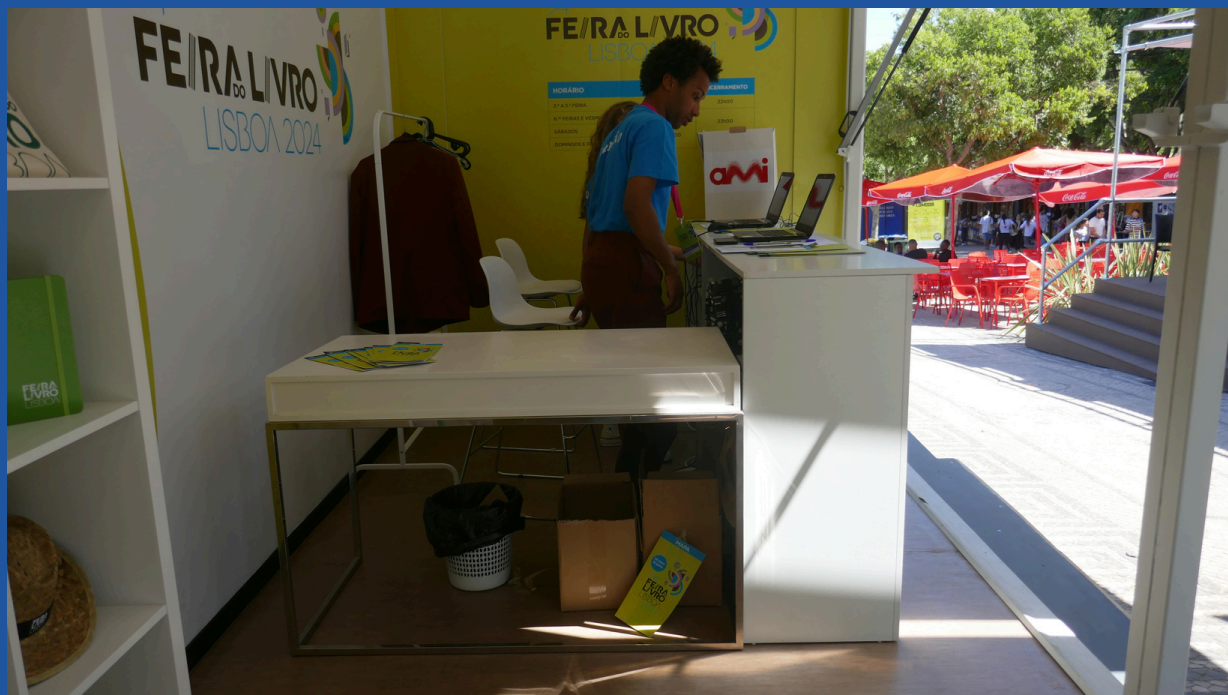
Balcão de informações rebaixado da Entrada Norte.

O balcão de informações da Entrada Norte tem o seguinte aspeto: