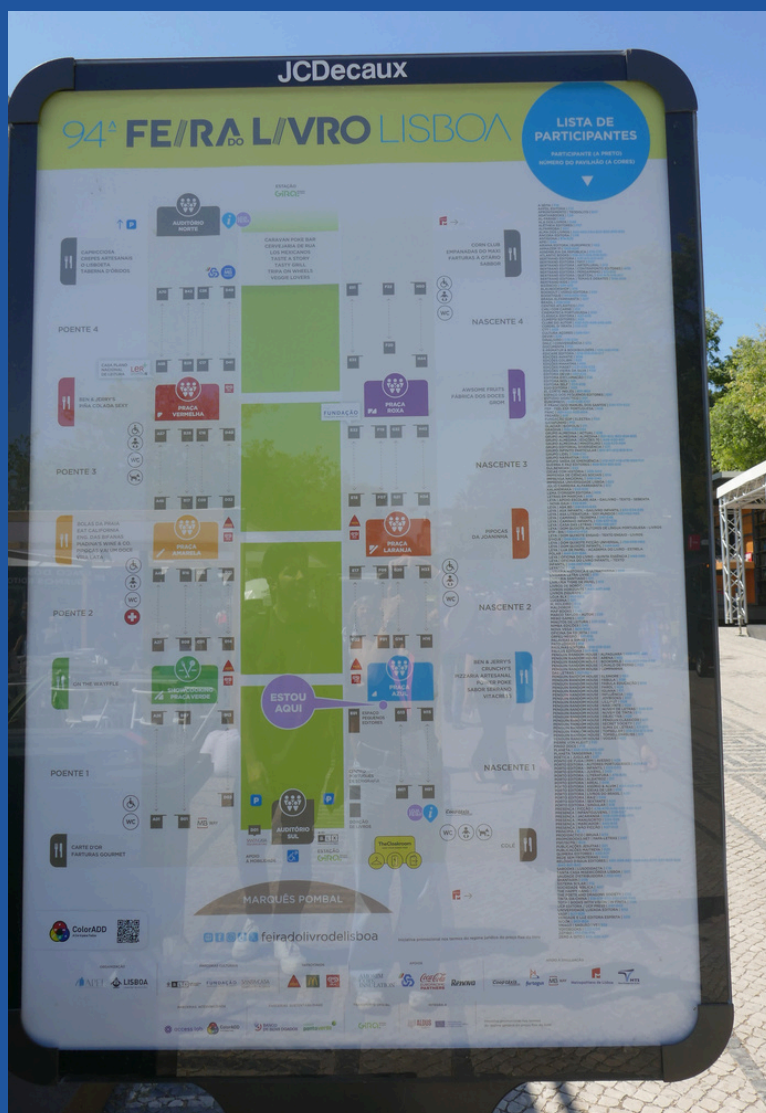
Mapa da Feira do Livro de Lisboa.

Durante o percurso da feira, encontra mapas que têm o seguinte aspeto (também pode descarregar o mapa de acessibilidade aqui ):