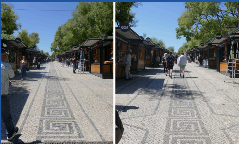
Percursos na Feira.

Este é o aspeto de alguns dos percursos pedestres ao longo da Feira do Livro de Lisboa.