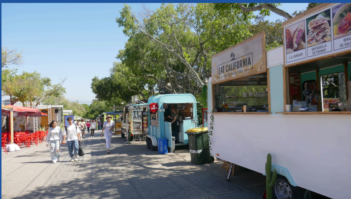
Zona de restauração.