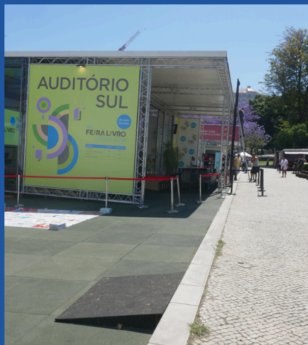
Entrada Sul - mais acessível

Esta é a entrada mais acessível da Feira do Livro de Lisboa (Entrada Sul). A entrada é feita pelas baias que se encontram na lateral direita do Auditório Sul.