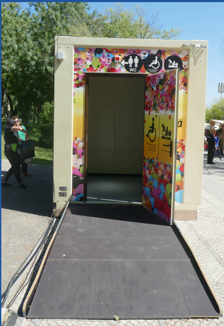
Aspeto exterior de uma casa de banho adaptada.

Em várias zonas do parque (pode consultar as zonas no mapa de acessibilidade que pode encontrar aqui ) pode encontrar casas de banho adaptadas que têm o seguinte aspeto.