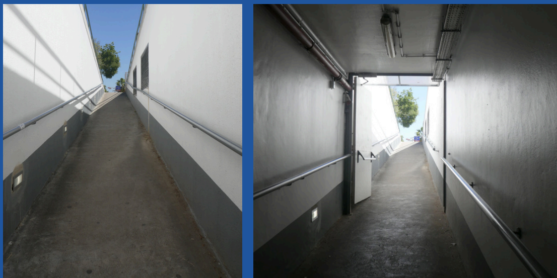
Acesso do parque à Feira do Livro.

Existe um parque de estacionamento subterrâneo pago que também dá acesso direto ao recinto da Feira do Livro e que tem o seguinte aspeto.