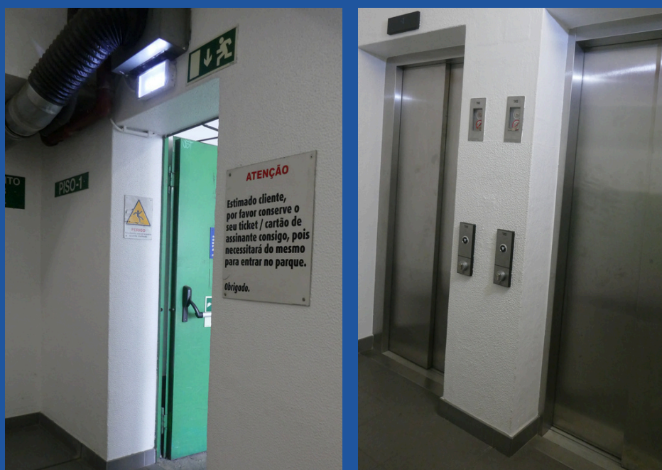
Acesso do parque à Feira do Livro.