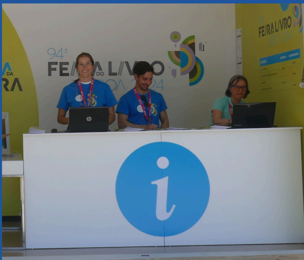
Identificação do staff.

Os membros do staff estão devidamente identificados com uma t-shirt azul e uma credencial com o nome da pessoa.