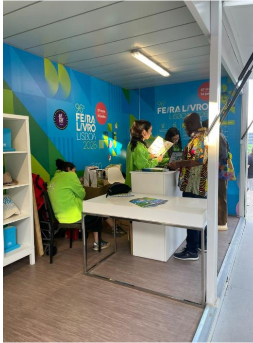
Balcão de informação rebaixado da entrada norte.