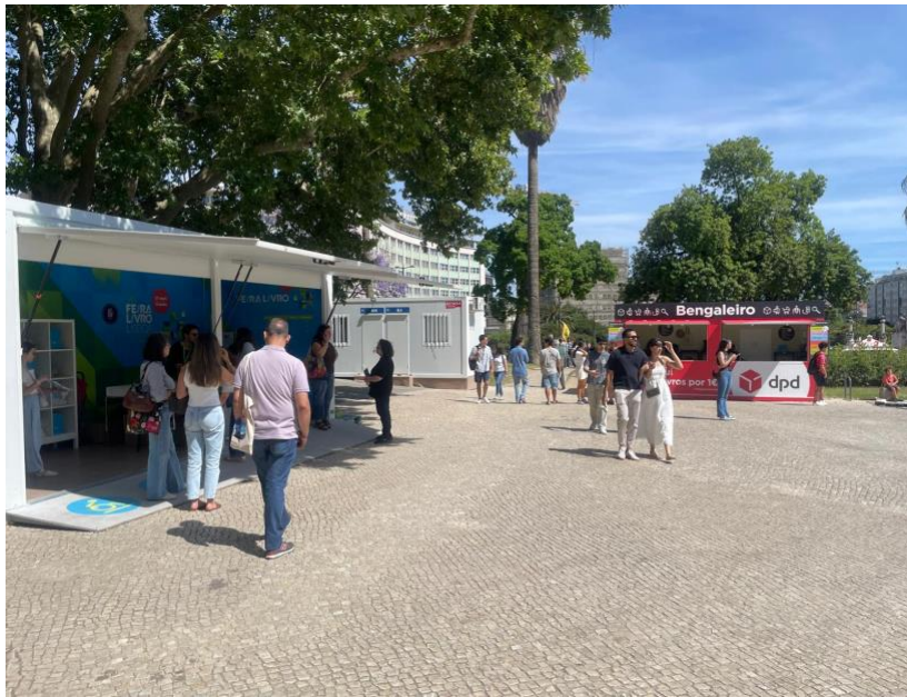
Zona envolvente do balcão de informação da entrada sul.