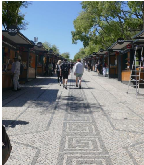
Percursos na Feira,