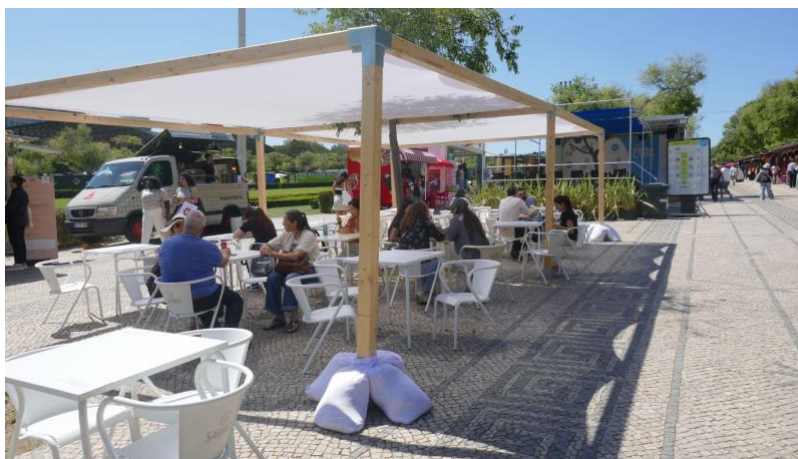
Zona de descanso.

Terá alguns lugares para descansar ao longo do percurso da feira e em alguns pavilhões poderá encontrar a música mais alta.