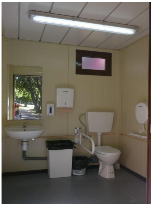
Aspeto interior de uma casa de banho adaptada.