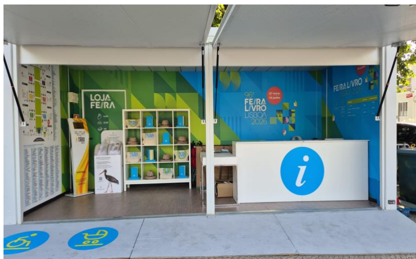
Entrada do balcão de informação da entrada sul.