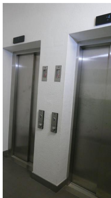
Acesso do parque à Feira do Livro.