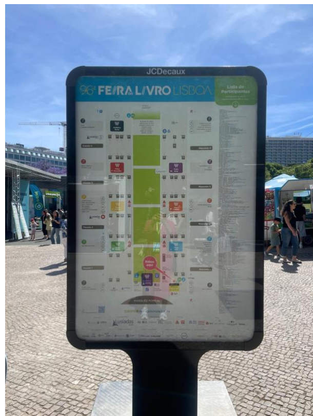
Mapa da Feira do Livro de Lisboa.

Durante o percurso da feira poderá encontrar alguns mapas que têm o seguinte aspeto (também pode descarregar o mapa de acessibilidade aqui ):