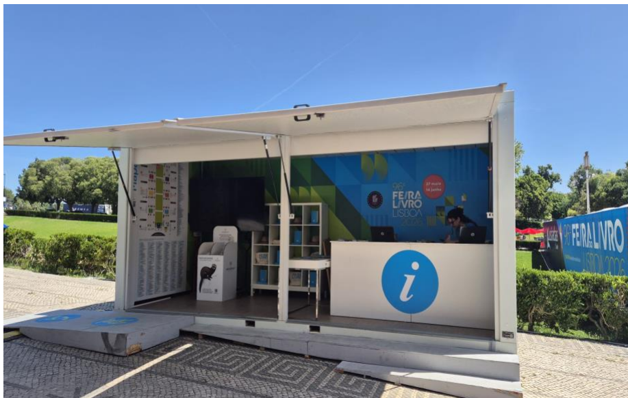
Entrada do balcão de informação da entrada norte.

O balcão de informação da entrada norte tem o seguinte aspeto: