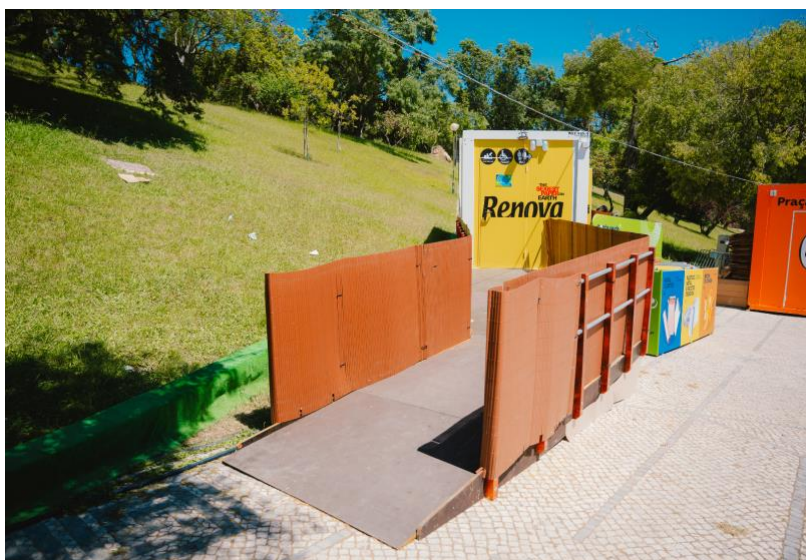
Aspeto exterior de uma casa de banho adaptada.

Em várias zonas do parque (pode consultar as zonas no mapa de acessibilidade que pode encontrar aqui ) poderá encontrar casas de banho adaptadas que têm o seguinte aspeto.