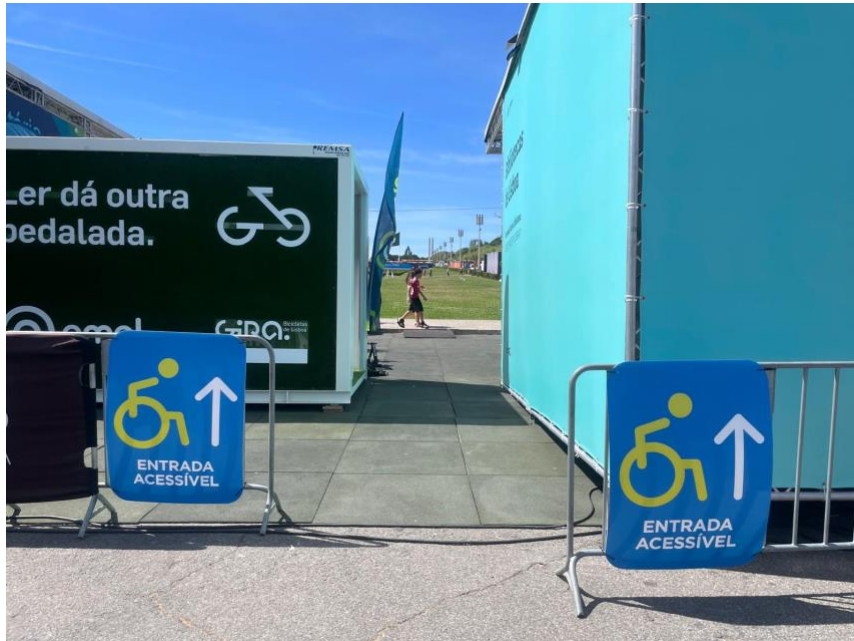
Entrada Sul - mais acessível

Esta é a entrada mais acessível da Feira do Livro de Lisboa (entrada sul). A entrada é feita pelas baías que se encontram na lateral esquerda do auditório sul.