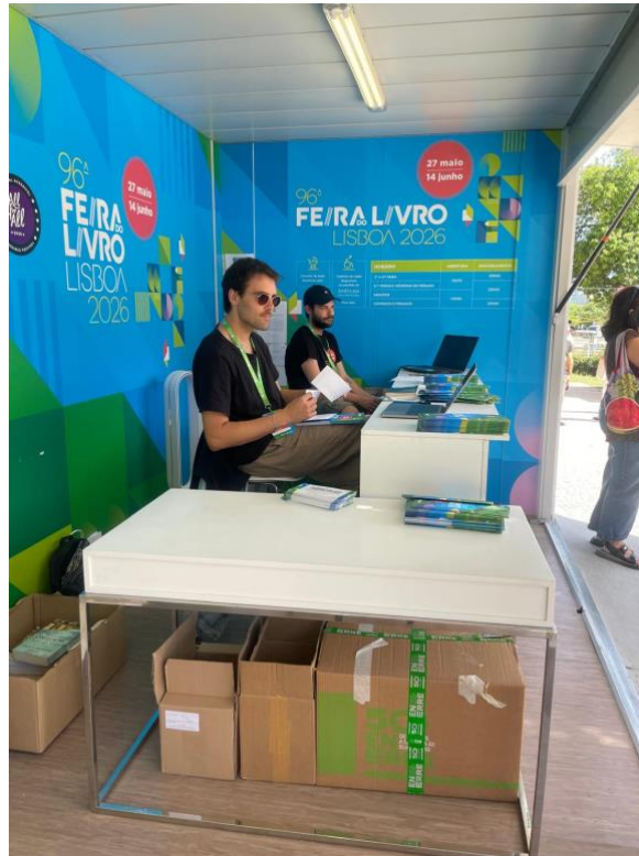
Balcão rebaixado entrada sul

O balcão de informação da entrada norte tem o seguinte aspeto: